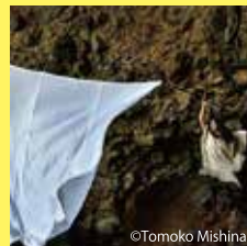
麻風 Mafu (大旗)